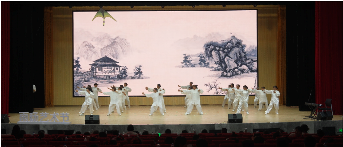
社区居民和孩子家长代表表演八段锦