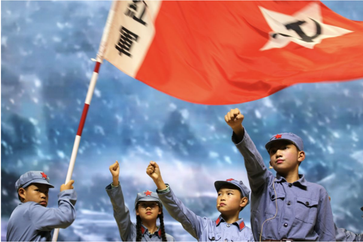
少年儿童演出以语文课《丰碑》改编的课本剧，宏扬红色革命文化